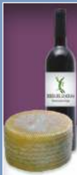
Fromage de Brebis and Ribera del Guadiana

La cuisine de Trujillo trouve ses racines dans la tradition séculaire et conventuelle: jambons et charcuterie de porc ibérique; vin de l'Appellation d'Origine Ribera el Guadiana ou encore fromages de brebis et de chèvre ne sont que quelques exemples de ses meilleurs mets. A souligner précisément l'importance de la Feria Nationale du Fromage de Trujillo, vitrine des meilleurs fromages fabriqués en Estrémadure et dans la péninsule.