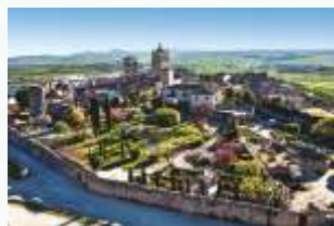
Vues de la ville depuis le château

Notre itinéraire commence sur la place Mayor , lieu choisi par la noblesse de Trujillo aux XV ème et XVI ème siècles pour y construire leurs grands palais, comme celui de Carvajal-Vargas, celui du Marquis de la Conquista ou celui de Orellana-Toledo. Nous commencerons par l' office du tourisme , où l'on nous offre des renseignements précis et détaillés sur tout ce qu'il y a à voir. La statue de Francisco Pizarro et l' église de San Martin seront notre première étape.