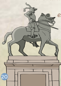
Statue de Pizarro

le premier explorateur du fleuve Colorado.