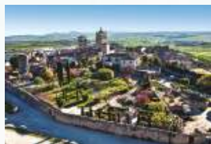
Vistas da vila desde o castelo

O nosso percurso inicia-se na praça Mayor , lugar escolhido pela nobreza da localidade para erguer os seus grandes palácios, como o de Carvajal-Vargas, o do marquês da Conquista ou o de Orellana-Toledo, durante os séculos XV e XVI. Começamos pelo posto de turismo, onde nos fornecem informação vasta e precisa de tudo o que podemos visitar. A estátua equestre de Francisco Pizarro e a igreja de San Martín , ambas na mesma praça, serão os nosso primeiros destinos.