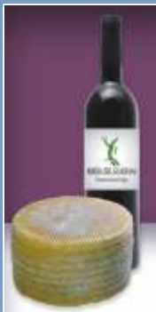
Queijo de Ovelha e Ribera del Guadiana

A cozinha tem as suas raízes na tradição secular e conventual: presuntos e enchidos de porco preto, o vinho, integrado na D.O "Ribera del Guadiana", ou os queijos de ovelha e de cabra, são algumas das suas melhores iguarias. E precisamente destaca-se, pela sua notoriedade, a Feira Nacional do Queijo de Trujillo, mostuário dos melhores queijos que se fazem na Extremadura e na península.