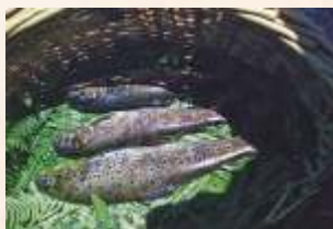
Trucha común (Salmo trutta)