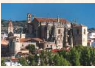
Catedral de Plasencia