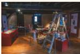
Museo de la Cereza (Cabezuela del Valle)

El momento de mayor afluencia turística y probablemente el más conocido a nivel nacional es la floración del cerezo, que colorea de blanco la práctica totalidad del valle. Suele durar unos diez días, entre mediados de marzo y primeros de abril, según las condiciones climatológicas, y durante ese tiempo se realizan festejos, degustaciones, rutas, etc. Está reconocida como Fiesta de Interés Turístico Nacional.