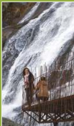
Cascada del Caozo (Valdastillas)

En el valle del Jerte todo es agua; gargantas, pozas, cascadas o chorreras, acequias... Pocas localidades no disponen de piscinas naturales para disfrutar del baño en las frías aguas de sus gargantas o del propio río Jerte. Incluso disponemos del hotel balneario Valle del Jerte, en el término de Valdastillas, para disfrutar de sus tratamientos termales y su spa.