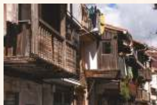
Arquitectura entramada en Navaconcejo

Descenderemos ahora hasta Valdastillas , parando unos 2 km antes para visitar la espectacular cascada del Caozo en la garganta Bonal , a la que accederemos por una pista asfaltada a nuestra derecha. Ya en el pueblo veremos buenos ejemplos de arquitectura entramada, que seguiremos apreciando valle arriba en la siguiente parada: Navaconcejo , donde pasaremos por la calle Real, antigua arteria local rematada con un bello crucero.