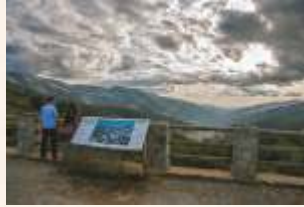
Tornavacas y el valle desde el puerto