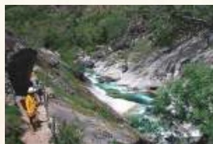
Los Pilones en la garganta de los Infiernos

El pueblo de Jerte es nuestro próximo destino, si bien antes es recomendable disfrutar de la reserva natural de la Garganta de los Infiernos , en cuyo centro de interpretación nos darán puntual información sobre la forma de visitarla. En cuanto a la localidad presenta el tipismo de la arquitectura popular entramada, sobre todo en el barrio de los Bueyes , la calle Coronel Gofñín y la plaza de la Independencia y sus alrededores.